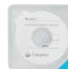
Beskyttende tetningsring konveks