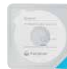
Beskyttende tetningsring konveks