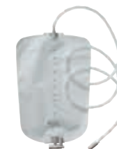
Conveen® Security+ nattpose