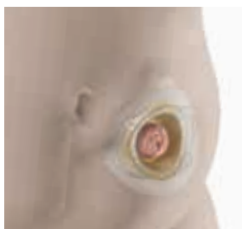
SenSura ® Mio Convex