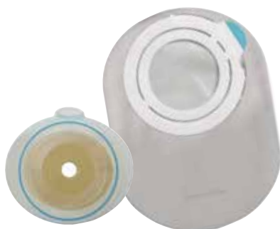
SenSura Mio Flex, 2-dels stomiustyr.