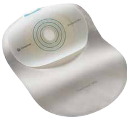
SenSura Mio, 1-dels stomiutstyr med elastisk hudplate

Bandasjen består av to deler – hudplate og pose. Først settes platen på huden og deretter festes posen til platen. Begynn med å feste platen nedenfra. Platen og posen byttes ved behov. Det vanlige er å bytte platen 2-3 ganger i uken, mens du bytter posen oftere.