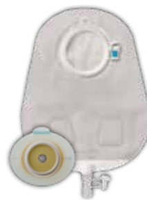
SenSura ® Mio Click 2-dels urostomipose med ringkobling