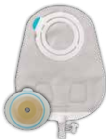
SenSura ® Mio Flex 2-dels urostomipose med kleberkobling