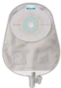
SenSura ® Mio 1-dels urostomipose